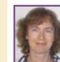
"Het waarachtige licht, dat ieder mens verlicht, was komende in de wereld." Johannes 1:9